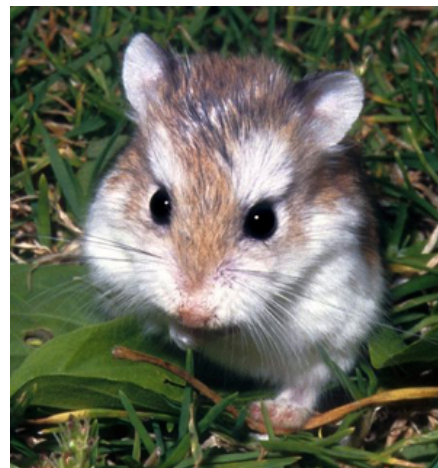
Roborovski dværghamster.