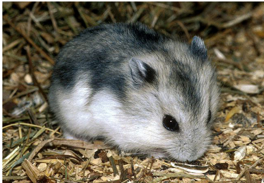
Vinterhvid dværghamster ( Phodopus sungorus ) er én af de tre ægte dværghamster-arter, der holdes i fangenskab.